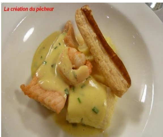
La création du pêcheur

La création du pêcheur (saumon, cabillaud, langoustines) accompagné du même Rueda.