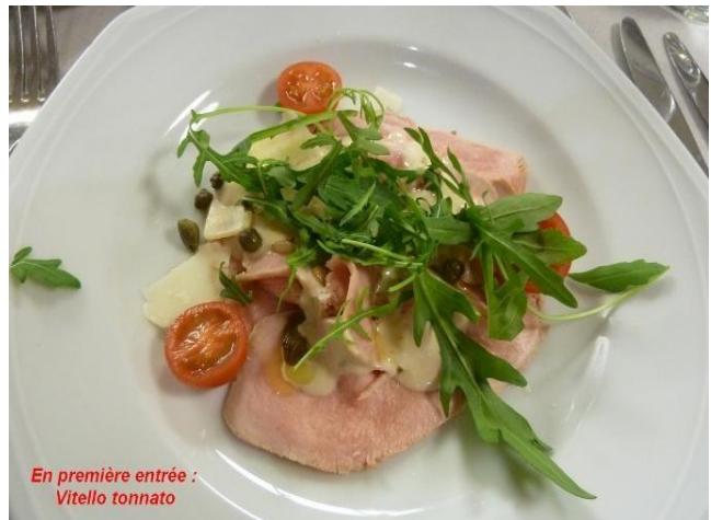
En première entrée : Vitello tonnato